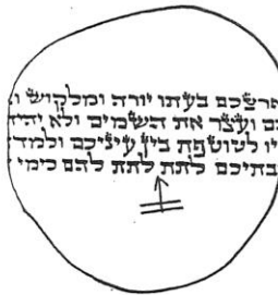
יהודי שנפטר בגיל 90 ולאחר פטירתו נבדקו תפיליו ב"מכון מאז" לאחר שבדקו בימי חייו מספר פעמים במקומות שונים ואלו התוצאות

ואפי' אם מגיע לקנות תפילין מתוך מודעות לכל הגיל בכ"ז יתכן שעדיין לא הניח תפילין כל ימיו, כדוגמת יהודי שנפטר בגיל תשעים ולאחר פטירתו נבדקו תפיליו, ובבדיקתם היה נראה שנרכשו מסופר מומחה שכתבם בכתב מהדר, ולעדות בני משפחתו התפילין נבדקו כמה פעמים בחייו ובכל זאת נמצאו פסולים! שהיה כתוב בהם "אבתיבם יתת לתת להם (נספח מס' 1)".